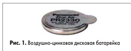
Рис. 1. Воздушно-цинковая дисковая батарейка

пригодится воздушно-цинковая батарея большой емкости. Она легко сопрягается с аппаратом так как специально изготовлена для этих целей. Ее емкости должно хватить на срок эксплуатации аппарата, вдвое превышающий период работы от аккумулятора, после чего ее можно выбросить и заменить новой.